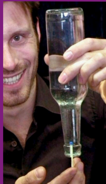
ZEIGEN & ERKLÄREN