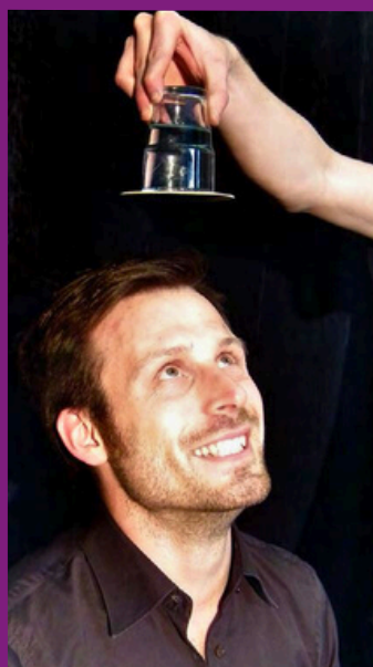
ERÖFFNEN MIT WITZ